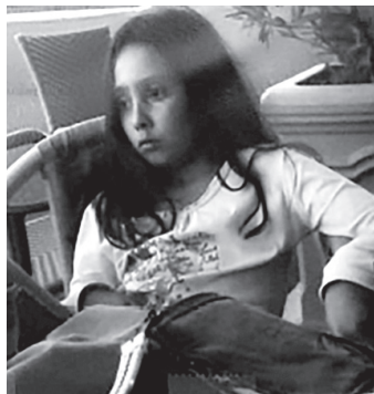
1 Figulina : Petite fille